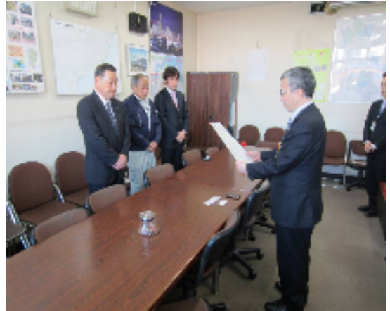
(都市整備局長室にて)